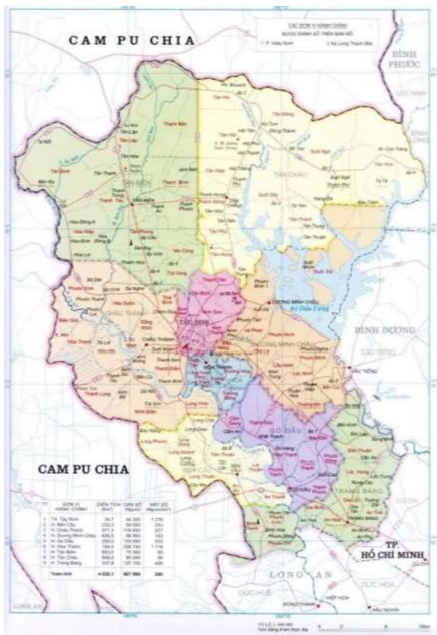
Bản đồ hành chính tỉnh Tây Ninh

Toàn tỉnh có 9 đơn vị hành chính cấp huyện (gồm 01 thành phố, 02 thị xã và 6 huyện), 94 đơn vị hành chính cấp xã (gồm 6 thị trấn, 17 phường và 71 xã). Tọa độ của tỉnh từ 10 o 57'08'' đến 11 o 46'36'' vĩ độ Bắc và từ 105 o 48'43'' đến 106 o 22'48'' kinh độ Đông, vị trí: